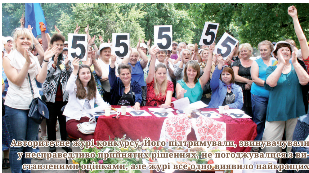
Авторитетне журі конкурсу. Його підтримували, звинувачували у несправедливо прийнятих рішеннях, не погоджувалися з висловленими оцінками, але журі все одно виявило найкращих

на»), хор клубів «Чарівна мить» та «Журавка», творчий пісенний осередок клубів «Зарічани» і «Промінь надії», хор клубів «Криниця життя» і «Росинка», хорівий колектив клубів «Вечірні зорі», «Золота осінь», «Щедрий вечір», «Осіннє золото».